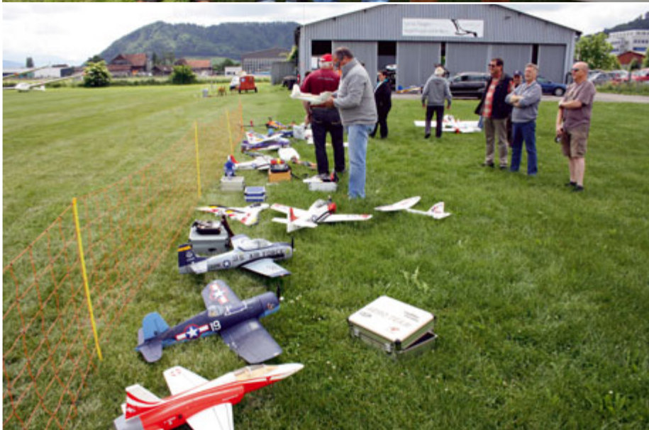
Vor dem ersten Segelflugstart (ganz oben links).