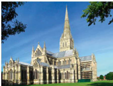
Kathedrale von Salisbury

Die berühmteste Kirchenguhr Englands ist ... klar der «Big Ben». Der berühmteste Turm ist wohl der «Tower of London». Einverstanden, aber wer weiss, wo sich die älteste Uhr und der höchste Kirchturm des vereinigten Königreichs befinden? Sie ahnen richtig: in Salisbury in der Grafschaft Wiltshire, 135 Kilometer südwestlich von Viktoria Station. Das bedeutendste Bauwerk der Kleinstadt ist die Kathedrale aus dem 13. Jahrhundert mit ihrer kunstvoll verzierten Westfassade. Mit 123 Metern ist der Turm der Kathedrale