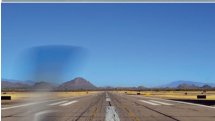
McDonnell RF-4E (oben), FTO Arizona, USA (links).