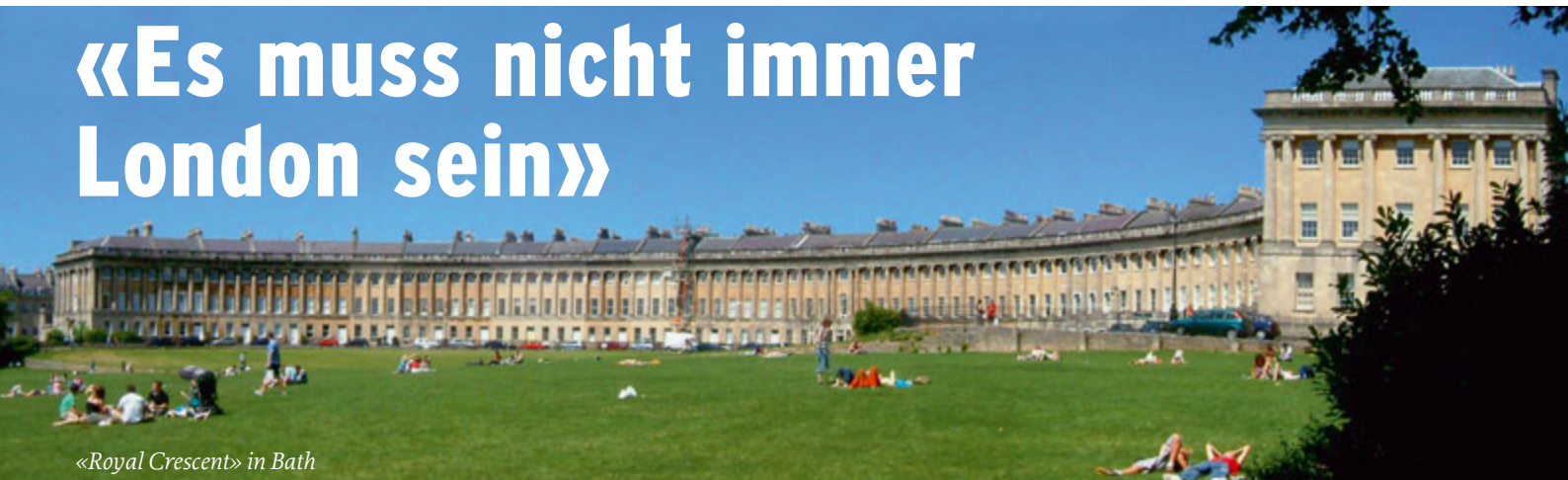
«Royal Crescent» in Bath

SkyWork Airlines bedient London City neu dreimal am Tag! Auch die Grafschaften rund um die Grossstadt bieten viel Sehenswertes. SkyWork Travel hat dazu einen interessanten Vorschlag.