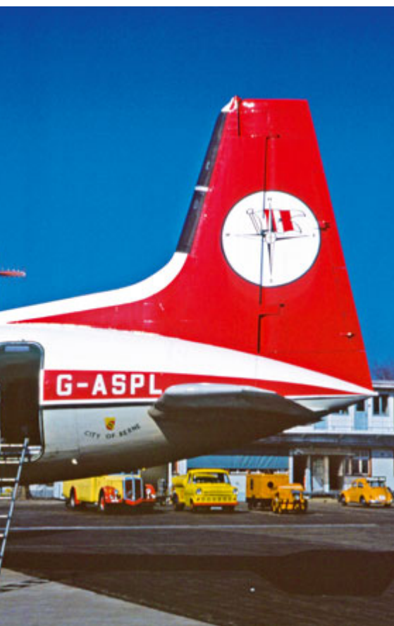
Am 17. April 1975 im Belpmoos auf den Namen «City of Bern» getauft: DAN-AIR Hawker Syddeley 748 G-ASPL.

Vor 40 Jahren, genauer am 5. Juni 1972, eröffnete die private englische Fluggesellschaft DAN-AIR die Linie London-Gatwick-Bern-Belp. Sie läutete damit eine Entwicklung des Luftverkehrs zwischen der Bundeshauptstadt und Grossbritannien ein, die ihr bis heute keine andere Fluggesellschaft wettgemacht hat: In 21 Jahren beförderte DAN-AIR rund eine halbe Million Fluggäste nach und ab Bern.