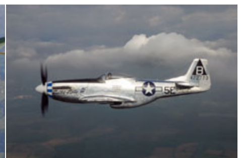
North American P-51 Mustang