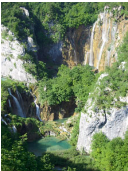
In einem der elf Nationalparks.