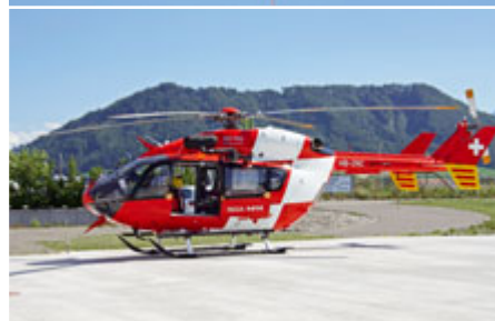
Die Flotte der Mountain Flyers (oben).