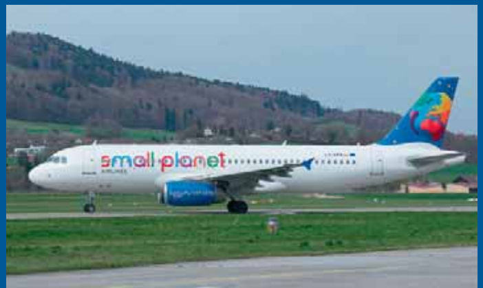
Anfangs April wurden die Passagiere von Small Planet Airlines mit dem Airbus A320-232 LY-SPA wieder in Bern abgeholt.