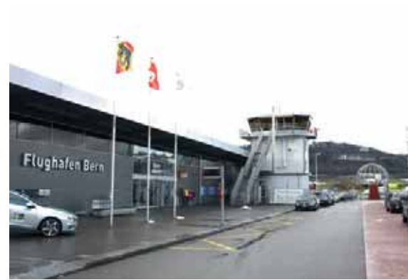
Oben: So sah der Terminaleingang während Jahren aus.