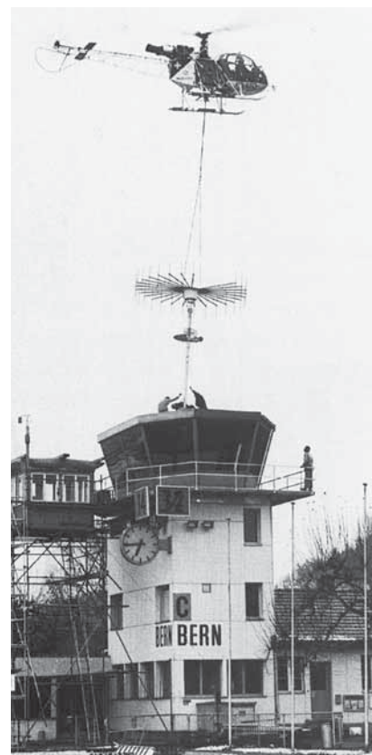
Towerumbau 1978: Die frühere Kabine wird durch eine Kanzel ersetzt und der Funkpeiler wird montiert.

1963 war der Kontrollturm erstmals aufgestockt worden, dann wieder 1978 mit einer neuen Kanzel und einem revidierten Funkpeiler. Zahlreiche Flugverkehrsleiter haben in der jetzt verschwundenen Baute zuverlässig ihren Beitrag geleistet