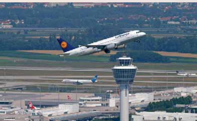
Von Drehkreuzen und alten Gewohnheiten (Seite 10)