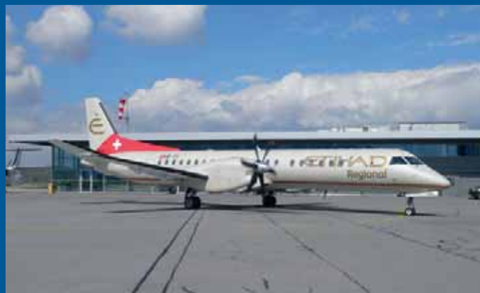
Im Frühling wurde Etihad Regional (ex Darwin) mit den Charterflügen nach Palma beauftragt. Das Bild zeigt die Saab 2000 HB-IYT kurz vor dem Start.