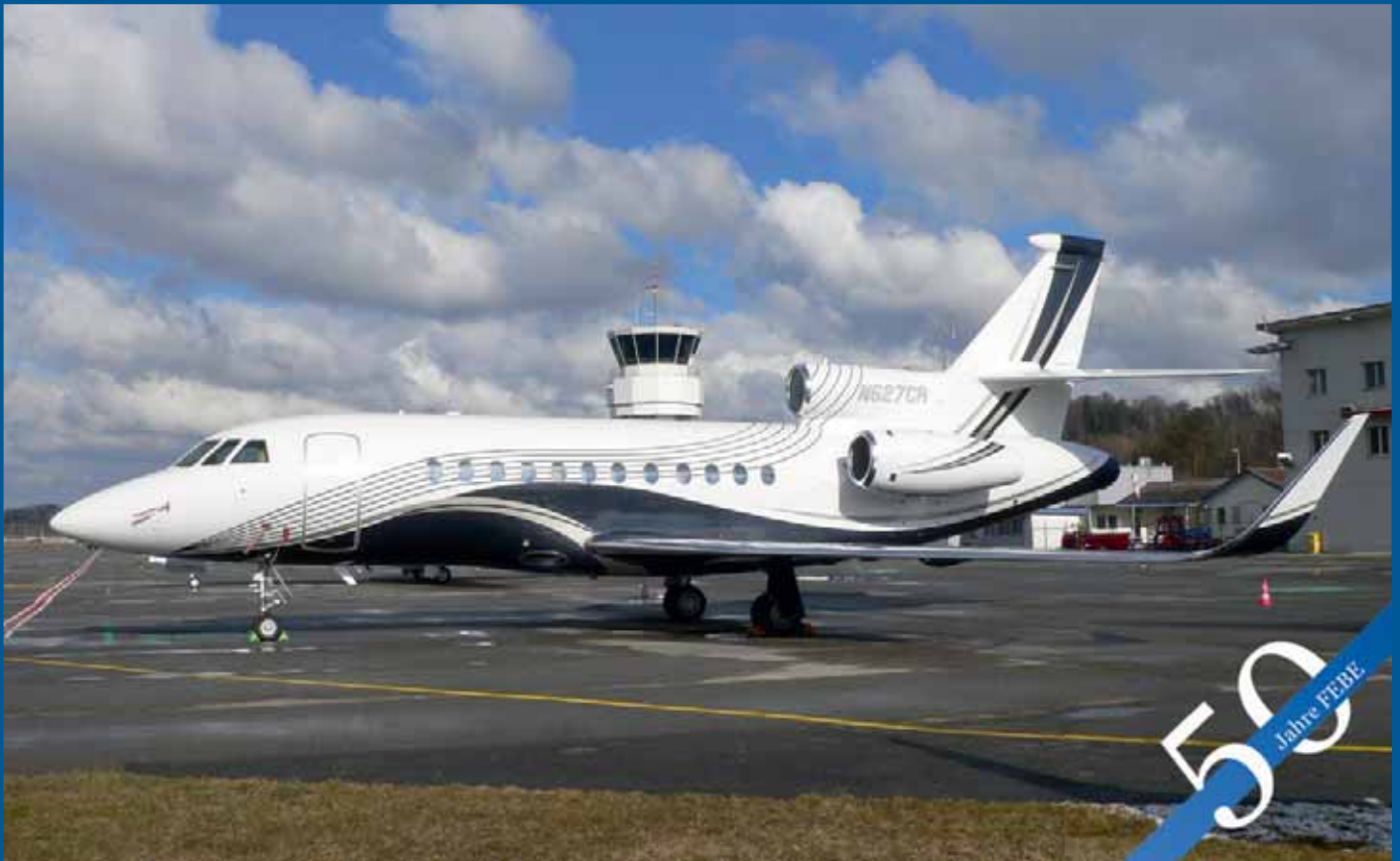
Wegen schlechten Wetterbedingungen in Sion landete die Falcon 900LX N627CR direkt aus den USA kommend in Bern.