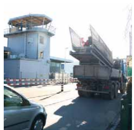
Oben: Abtransport der Metalltreppe für einen neuen Verwendungszweck.