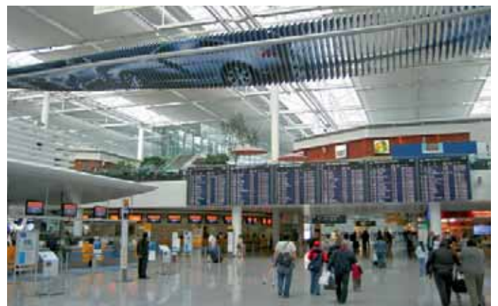
Flughafendrehkreuz München, Abflughalle.