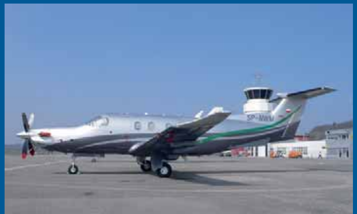
Die fabrikneue polnische PC-12/47E SP-NWM zeigte sich im März erstmals auf dem Tarmac.