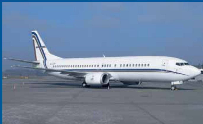
Die Boeing B737-406 SX-ATF der griechischen GainJet wurde für einen Fussballcharter aus Liverpool eingesetzt.