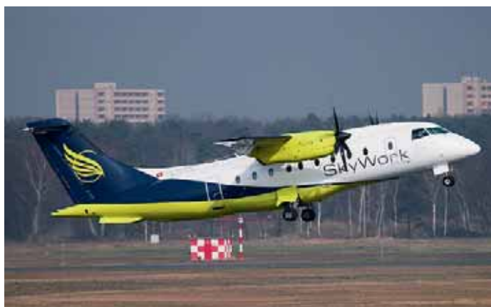
Do-328 von SkyWork Airlines am Flughafen Berlin-Tegel.

Ab Bern in zwei Stunden in Barcelona oder Berlin. Mit SkyWork Airlines bleibt Ihnen viel Zeit zum Geniessen und Erkunden der Top-Metropolen und an den beliebtesten Badedestinationen Europas.