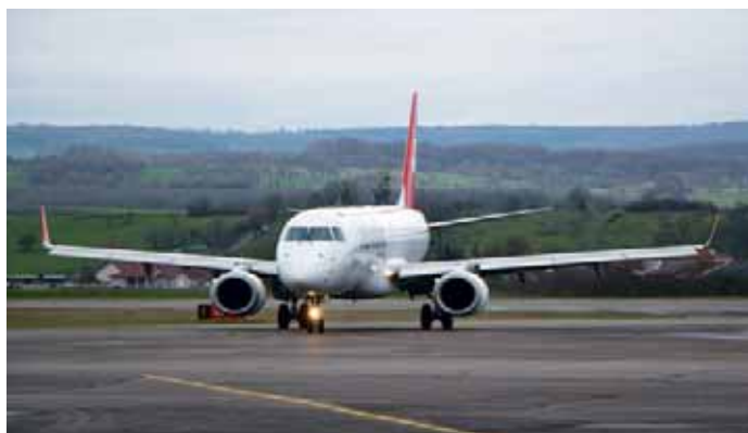
Embraer 190 von Helvetic Airways.

Helvetic Airways fliegt im September und Oktober erneut nach Djerba. Tauchen Sie ein ins orientalische Flair der tunesischen Mittelmeerinsel. Zudem diesen Herbst neu und erstmals ab Bern: Flüge bis in die Südtürkei nach Antalya.