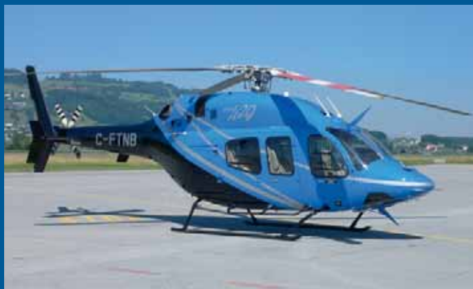
Am 24.6.2010 wurde als Typenpremiere der kanadische Werkshelikopter Bell 429 C-FTNB auch in Bern der Presse vorgestellt. Kurz darauf kaufte Air Zermatt ein Exemplar dieses Typs.