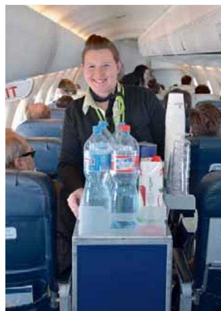
Freundliche Betreuung an Bord.