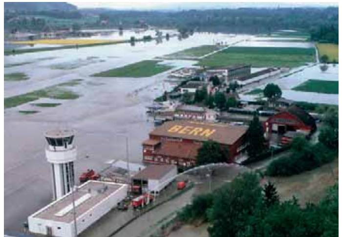
Im Mai 1999 stand der Flughafen während Tagen grossflächig unter Wasser.