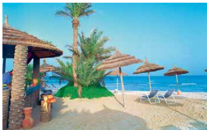
Nach Djerba mit Helvetic Airways.