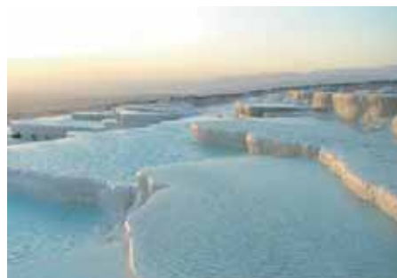
Kalksinterterrassen von Pamukkale.