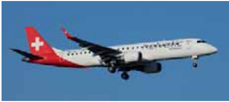
Embraer 190 von Helvetic Airways.

Nonstop mit dem Flugzeug von Bern nach Vorderasien!