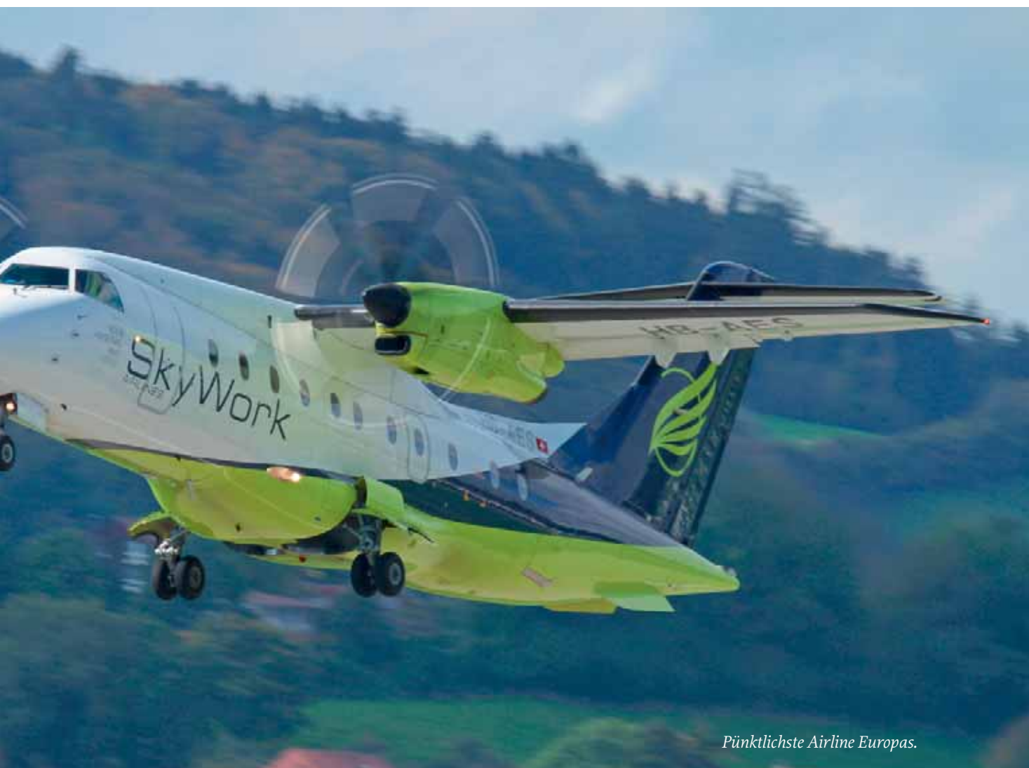
Pünktlichste Airline Europas.