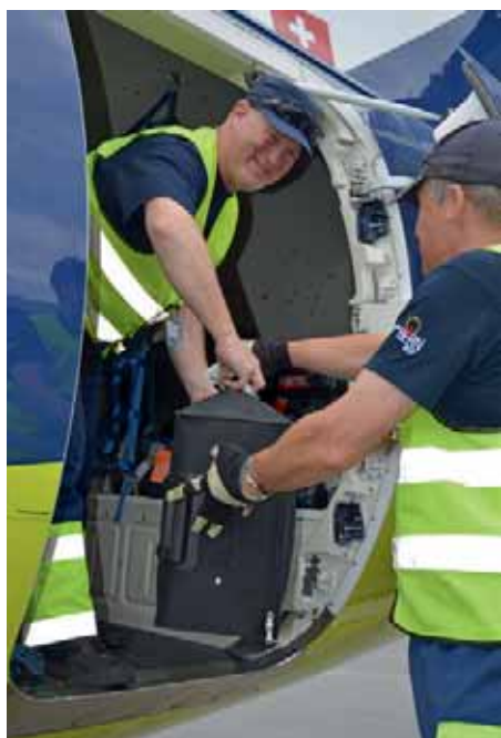
Freigepäck: kann bis zum Zielflughafen aufgegeben werden.

Bei weiterführenden Flügen ab den angefliegenen europäischen Hubs ein entscheidender Vorteil ist schliesslich die Möglichkeit, das Gepäck bis zum Ziel durchzuchecken. Das heisst, das Gepäck wird in Bern aufgegeben und kann am Zielort (auch nach mehreren Flugetappen) ohne weiters Zutun wieder in Empfang genommen werden. Schliesslich profitiert auch der Fluggast von SkyWork Airlines von den einzigartigen Vorteilen des Regionalflughafens Bern mit der kurzen Abfertigung und den günstigen Parkmöglichkeiten.