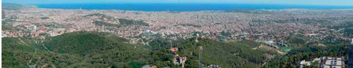
Zum Beispiel mit SkyWork Airlines nach Barcelona.

... zu den beliebtesten Badedestinationen rund ums Mittelmeer, den Top-Metropolen Europas und zu über 200 Destinationen weltweit.