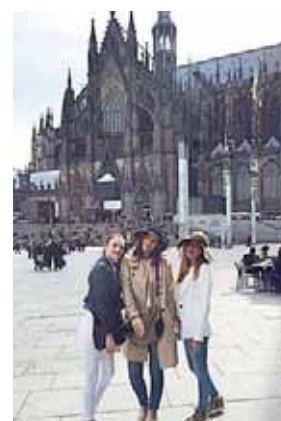
Vor dem Kölner Dom. >