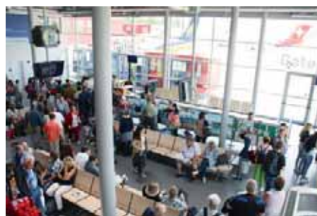
Korsika-Ferienstärker im Berner Abflugterminal.