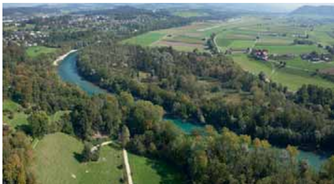
Hochwasserschutz ist auch Naturschutz. Oben der Berner Flughafen.

Bereits nach dem Hochwasser 1999 legte der Kanton Bern eine Lösungsvariante vor, die allerdings auf Kritik stiess. In einem neuen, aufwendigen Anlauf wurde das Projekt von den Fachleuten zusammen mit den Gemeinden Belp, Kehrsatz, Köniz, Muri und dem lokalen Wasserbauverband überarbeitet.