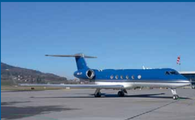
GAMA Aviation setzt die blaue Gulfstream G5 HB-JTT als Langstrecken-Jet ein.