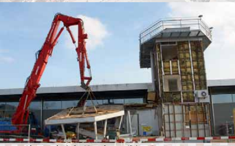
Altes verschwindet, Neues kommt (Seite 16)