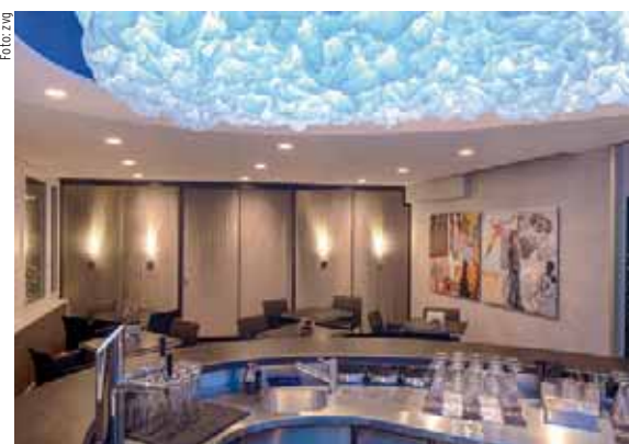
Oben: Cat's Corner Cafe-Bar am Flughafen Zürich.