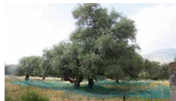
Zum Ernten der reifen Kastanien werden grosse Bodennetze ausgebreitet.