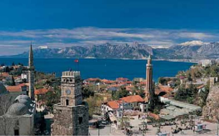
Antalya – neuer Direktflug mit Helvetic Airways (Seite 7)