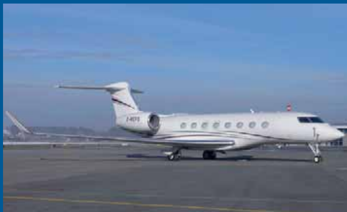
Direkt aus Indien kommend landete die Gulfstream G650 G-REFO am frühen Morgen in Bern.