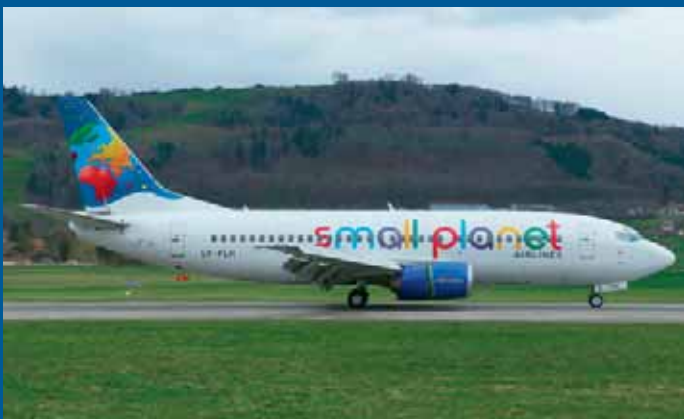
Small Planet Airlines, eine litauische Charterfluggesellschaft, welche mit 2 Boeing B737 und 7 Airbus A320 operiert, brachte Ende März mit der Boeing B737-382 LY-FLH eine Reisegesellschaft von Paris nach Bern.