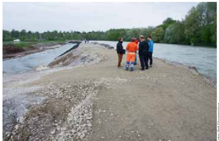
Mit erhöhten und verstärkten Dammbauten will man künftigen Hochwassern vorbeugen.

Dieses Gesamtprojekt «Hochwasserschutz und Auenrevitalisierung Aare/Gürbemündung» war genehm und wurde in vier heute bereits ausgeführte Teilprojekte zerlegt: