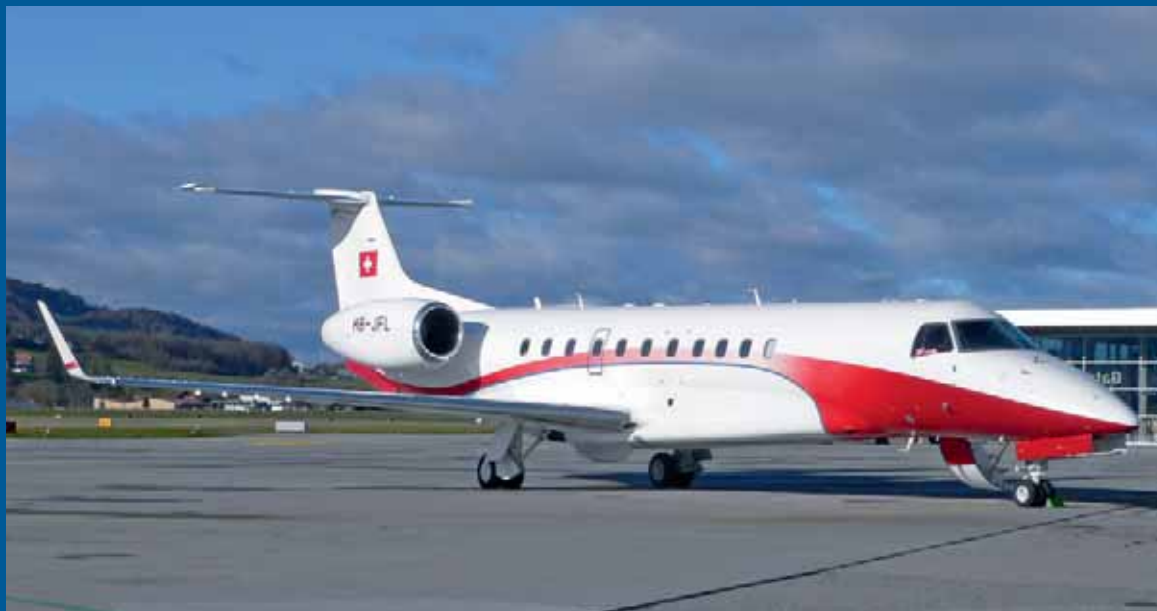
Nomad Aviation operiert die schön bemalte Embraer Legacy 600 HB-JFL.

Speziell schöne, interessante oder seltene Flugzeuge und Helikopter, aufgenommen von Fotografen der Flugzeugerkennung Bern FEBE.